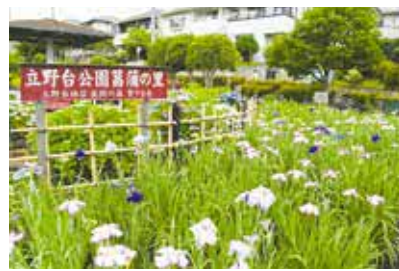
立野台公園のハナシヨウブ