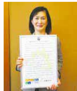
「座間市ゼロカーボンシティ」宣言文書を持つ市長

今後改定する「次期座間市環境基本計画」の中で、「座間市ゼロカーボンシティ」を効率的に実現できる施策を検討します。