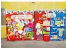
日々のご協力で感謝を伝えるために作成したパネル