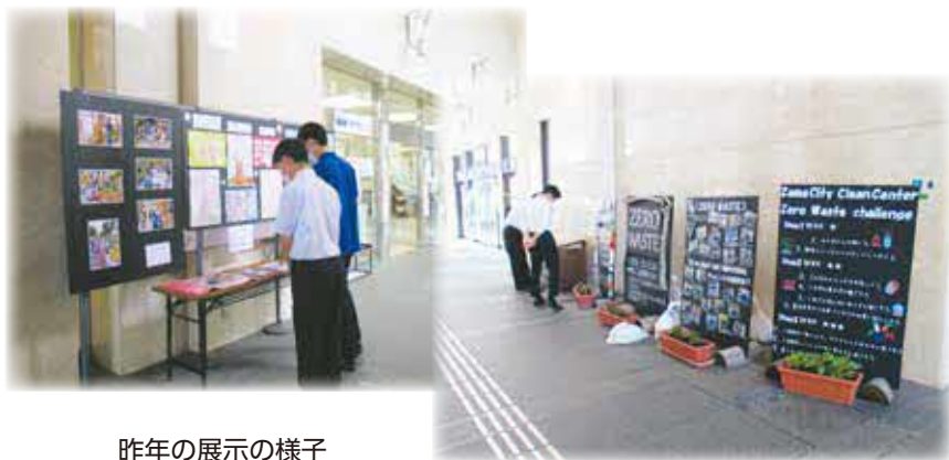
昨年の展示の様子