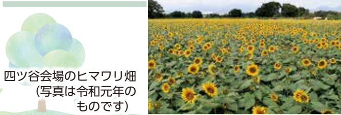
四ツ谷会場のヒマワリ畑 (写真は令和元年の ものです)