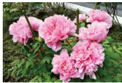
友好交流都市の須賀川市から寄贈を受けたポタン(市役所1階中庭)