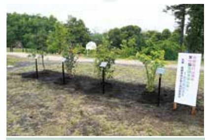
昨年実施した植樹の様子