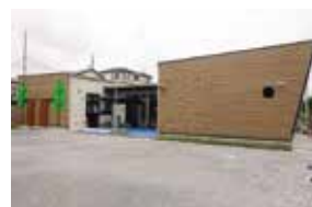
完成した東原保育園

令和2年度に実施した耐震診断の結果、建て替えが必要となったため、令和3年度に公募型プロポーザルを実施し、建て替えを行う民間事業者を決定しました。民間事業者が持つ技術力とスピード感によって、令和3年度末に新しい園舎が完成し、子どもたちが毎日元気に登園しています。7月末には園庭の整備を終え、8月からは子どもたちが園庭で元気いっぱい遊んでいます。