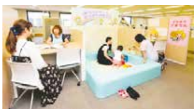
ネウボラざまりん