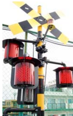
全方向踏切警報灯(相模工場屋上)

「まず、外に設置している踏切警報灯ですが、足を止める人も少なくないのでは？」 弊社で開発した警報灯です。耐久性のテストも兼ねて朝から夜8時まで点灯させています。今では会社の目印にもなっていますね。近くに来て写真を撮っていき人や、子ども連れで見に来る方もいらっしゃるようです。 「設計・製造している製品について聞かせてください。」 踏切用品・信号機類など、検知・記憶・表示に関する製品を取り扱っております。主軸は、踏切制御子(せいぎよし)といって、電車の接近と通過を検知し踏切設備を制御する機器です。一般の人の目には触れることはありませんが、なくてはならない機器です。 「一般の人が目に見えるものでは何がありますか？やはり、踏切で電車が通過するときに点灯する踏切警報灯がそうですね。」