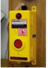
列車非常停止ボタン箱(相模工場内)

「これからの展望は？」 2014年の3月に創立70周年を迎えます。鉄道の安全・安定輸送に貢献することを目的に「セーフティ&エコロジー」をスローガンに掲げ、これからも日々適進して行きたいと思っています。