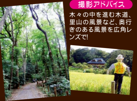
撮影アドバイス 木々の中を進む木道、里山の風景など、奥行きのある風景を广角レンズで!