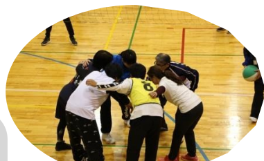
円陣組んで気合い十分!!