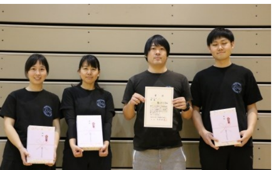
一般初心者の部 優勝 栗小ラーメン部