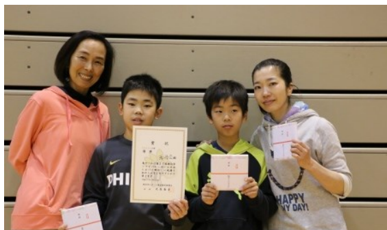
ファミリーの部 優勝 孫悟空