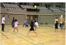
ソフトバレーボール

今回はファミリーチームが多く、最初はネットを挟んで親子でボールを打つ練習を行い、慣れたところでファミリー対決のゲームを行いました。