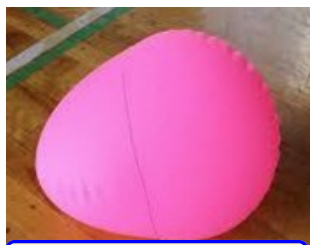
おむすび型のボール

続いて「ワンバウンド・ふらばる・バレエボール」の実技研修です。その名の通り、「ワンバウ