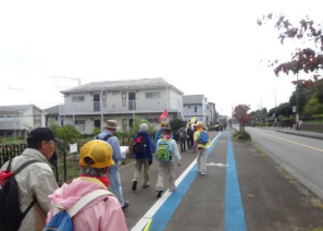
健康的にウォーキング！