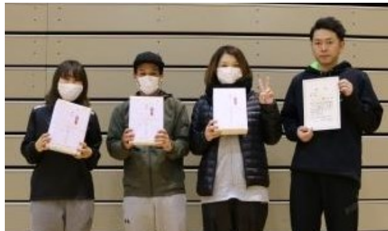
一般経験者の部 優勝 Brave