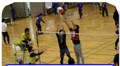
白熱したゲームがたくさん☆