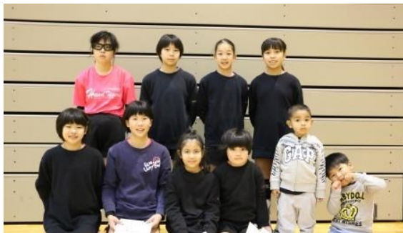
ジュニアの部 優勝 おかし