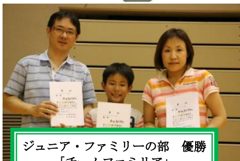
ジュニア・ファミリーの部 優勝 「チームファミリア」