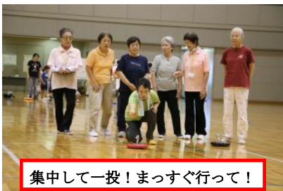
集中して一投!まっすぐ行って!