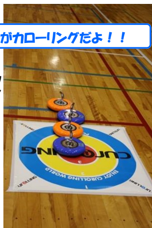
これがカラーリングだよ!!

7月23日(日)、スカイアリーナ座間に多くの参加者が集まりカラーリング大会が開催されました。