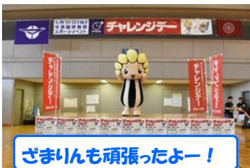
ざまいんも頑張ったよー!

そして、見事初勝利です! 参加者56,8%、514人、参加者43,8%と昨年の結果を大幅に上回った勝利です。