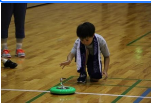
みんな真剣な表情だ!

教室では、用意された各コートにチームごとに分かれ、ゲームを行いました。なかなか思い通りに床を進んでくれないジェットローラー。どのコートでも一投ごとにアドバースや声援が聞こえ、熱のこもったゲームが展開されました。初めての方でも楽しめる『カラーリング』。次回の皆様のご参加をお待ちしております。