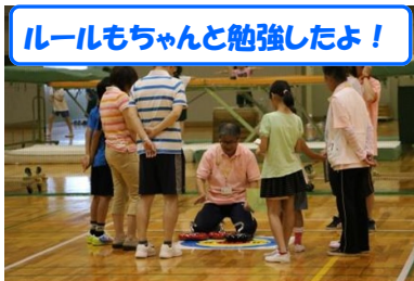
ルールもちゃんと勉強したよ!

カラフルなジェットローラーを床に滑らせ、ポイントゾーンに停止させて合計得点を競い合います。「カラーリング」をヒントに誕生したニュースポーツです。