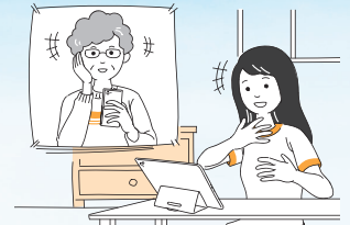
●家族や友人との会話