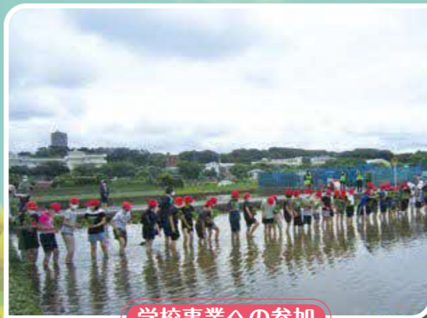
学校事業への参加