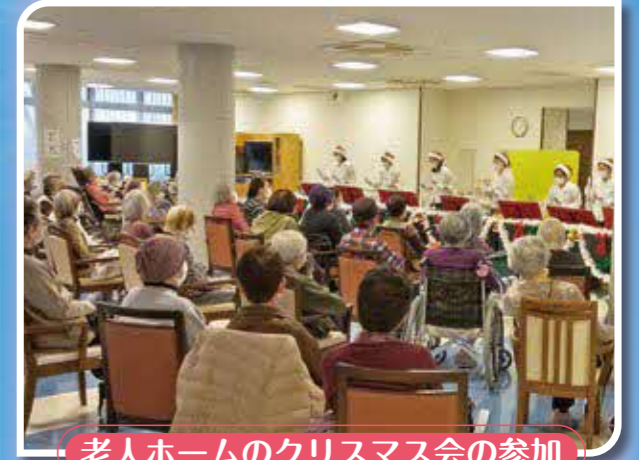
老人ホームのクリスマス会の参加