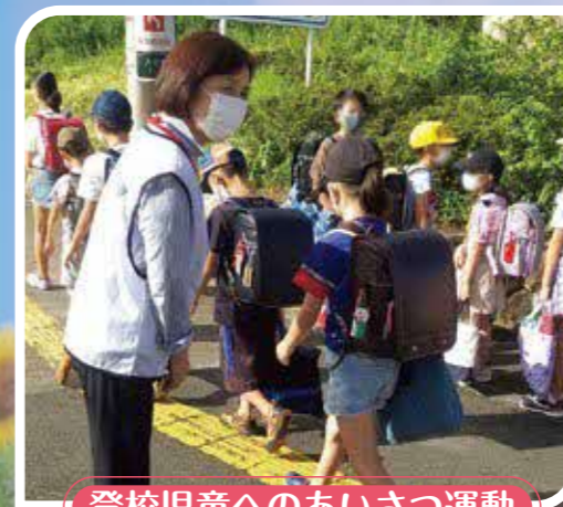
登校児童へのあいさつ運動