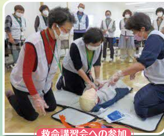
救命講習会への参加