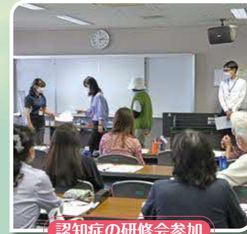
認知症の研修会参加