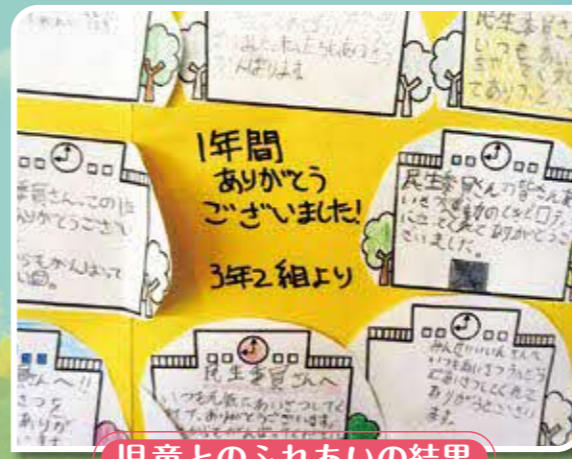
児童とのふれあいの結果