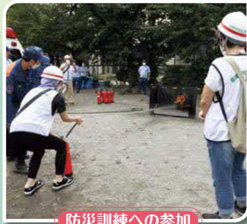
防災訓練への参加