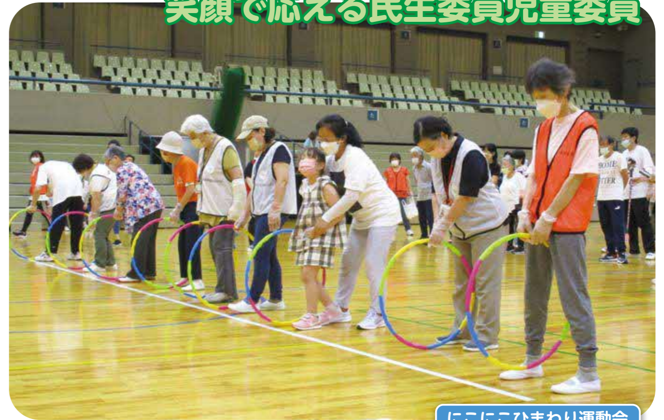
にこにこひまわり運動会