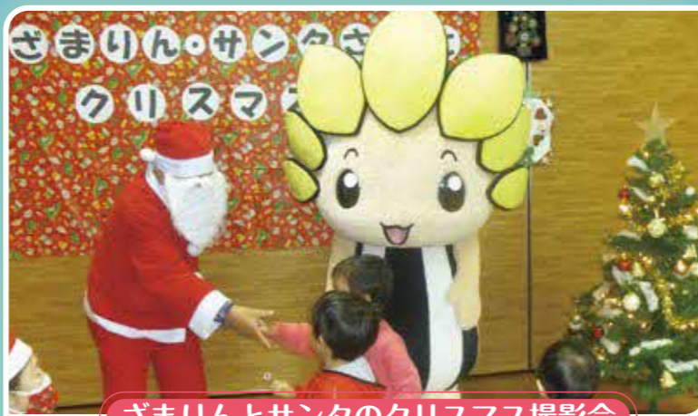
ざまりんとサンタのクリスマス撮影会