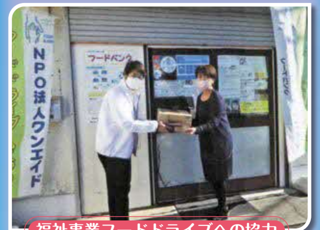
福祉事業フードドライブへの協力