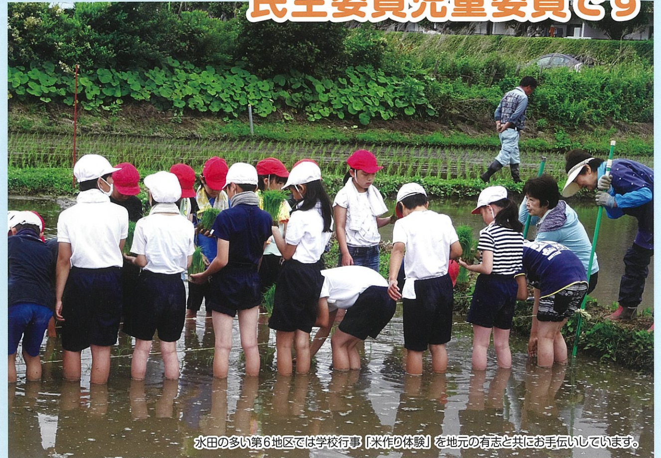
水田の多い第6地区では学校行事「米作り体験」を地元の有志と共に手伝いしています。