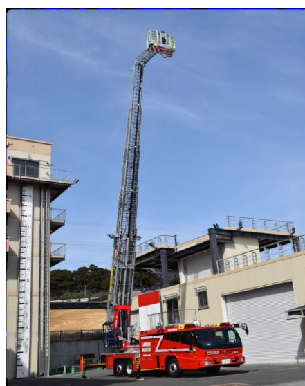
全起立・全伸長・全屈折