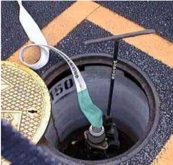
消 火 栓