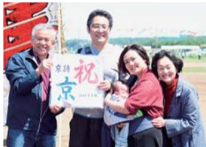
ミニ凧を受け取り初節句を祝う家族

○受取方法 当選はがきと代金を5月4日（土）・5日（日）午前10時～午後3時に、大風まつり会場（座架依橋北側）本部隣の受け渡しテントへ持参