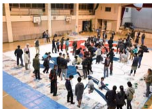
協力して文字書きをする様子