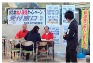
加入促進キャンペーンの窓口対応

市自治会総連合会（市自連）には179の単位自治会があり、餅つきやどんど焼きといった行事やゴミ集積所の管理、募金の取り扱い、回覧板での情報伝達など地域生活に関わるさまざまな活動を行っています。市自連は自治会活動の支援や情報発信の役割を担っており、その運営は13ある地区自治会連合会から選出された代表者が理事や役員の役職であり、3月18日（月）から23日（土）までは市役所1階市民ホールで自治会加入促進キャンペーンを行います。4月には市自連ホームページをリニューアルし、エクセルの会計システムや一時集合場所ポスターのひな型など自治会の活動に役立つツールがトップページからすぐに分かるように工夫しました。