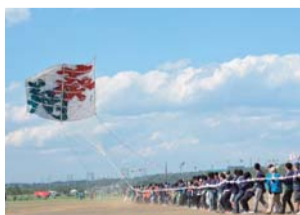
大迫力の大風を引き揚げます