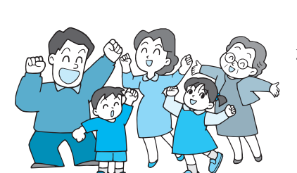
第三次行政改革大綱の最終年度である平成十七年度についても現在、積極的に行政改革推進に向け取り組んでいます。