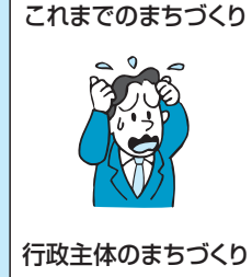
行政主体のまちづくり

治体として自主的なまちづくりが可能となる一方、各自治体が自らの決定と責任でまちづくりを進めることが強く求められています。しかし、厳しい経済情勢や情報化社会の進展、市民ニーズの多様化・高度化などを背景に、これまでの行政主導のまちづくりでは、地域特性に合った個性豊かなまちづくりは困難となっています。そこで、そこに暮らす人々が本当に望んでいる「まち」を作っていくためには、市民参加による協働のまちづくりがどうしても必要となっているのです(上図参照)。