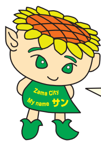
ひまわり イメージキャラクター 「サン」

※ひまわり広場や周辺には駐車場はありません。ご来場には電車・バスをご利用ください。路上駐車や農地への車の乗り入れはご遠慮ください。 ※ひまわり広場内は日影が少ないので、帽子をかぶるなど日よけ対策を忘れずに。 ※開花時期は天候によって前後します。