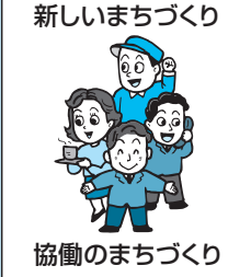
協働のまちづくり