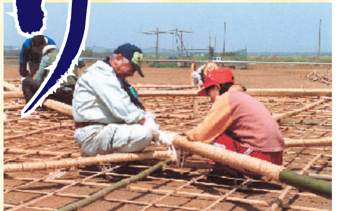
去る4月17日には大凧の骨組みが無事完成しました。

ところ 相模川グラウンド(6面参照) ※大凧まつり会場に駐車場はありません(無料バスをご利用ください)。 ※危険防止のため立入禁止区域がありますのでご注意ください。